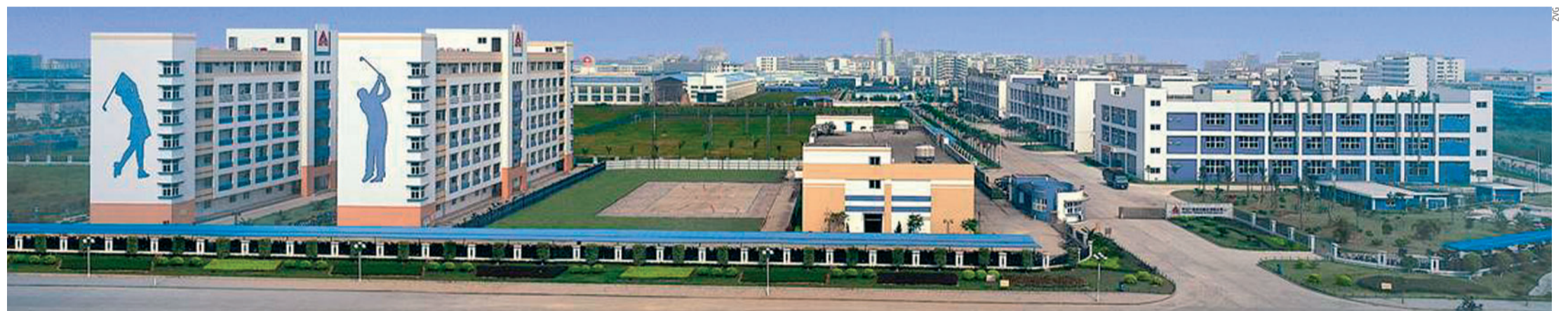
Golfschlägerproduktion in China: Die Fu Sheng Group, weltgrösster Hersteller von Schlägerköpfen, besitzt in der Provinz Kanton gleich zwei Fabriken.